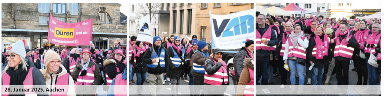
28. Januar 2025, Aachen