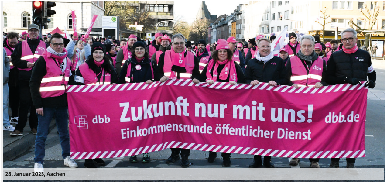
28. Januar 2025, Aachen

Mit einem ersten Warnstreik in Aachen sendeten die Beschäftigten am 28. Januar 2025 ein lautstarkes Signal an die Arbeitgebenden in der Einkommensrunde mit Bund und Kommunen. Über 1.000 Teilnehmende sammelten sich vor dem Aachener Hauptbahnhof und marschierten anschließend durch die Innenstadt, vorbei an zahlreichen Verwaltungseinrichtungen, um ihren berechtigten Forderungen Nachdruck zu verleihen.