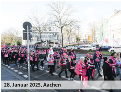
28. Januar 2025, Aachen