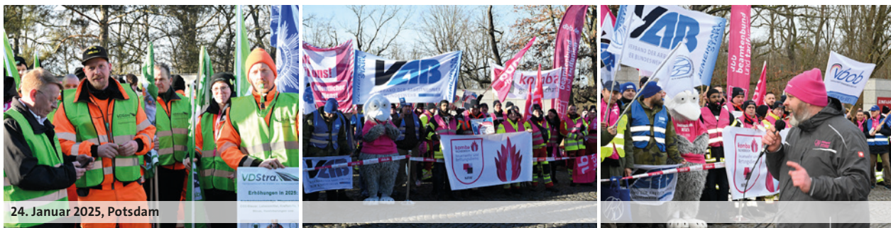
24. Januar 2025, Potsdam