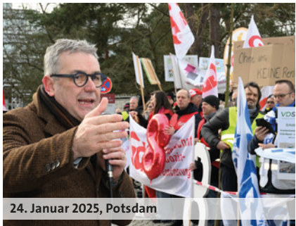
24. Januar 2025, Potsdam